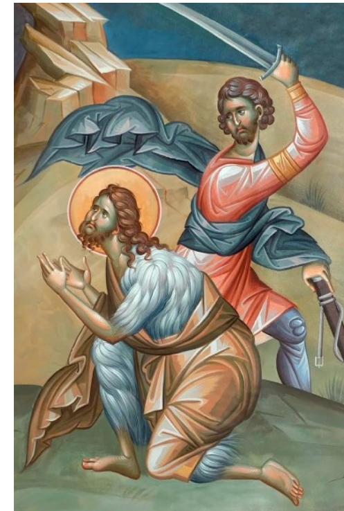
The Beheading of the Holy Prophet, Baptist, and Forerunner John Усікновення Чесної Голови Св. Пророка, Предтечі, і Хрестителя Іоана